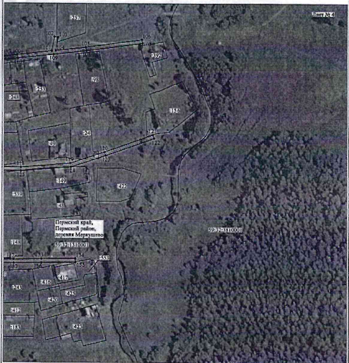
Схема расположения границ публичного сервитута объекта